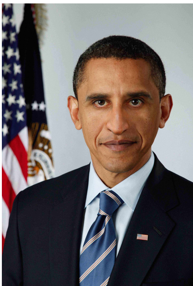
Self-portrait (obama) – stampa digitale, 21x30cm. 2012

anche perchè non si smette mai di vivere, vista la possibilità di mischiarci con i miti - anche a buon mercato - che il mondo della politica, della religione o della cultura ci regalano. la fama, forse, ci regala l'ebrezza di sembrare eterni. Carpe diem .